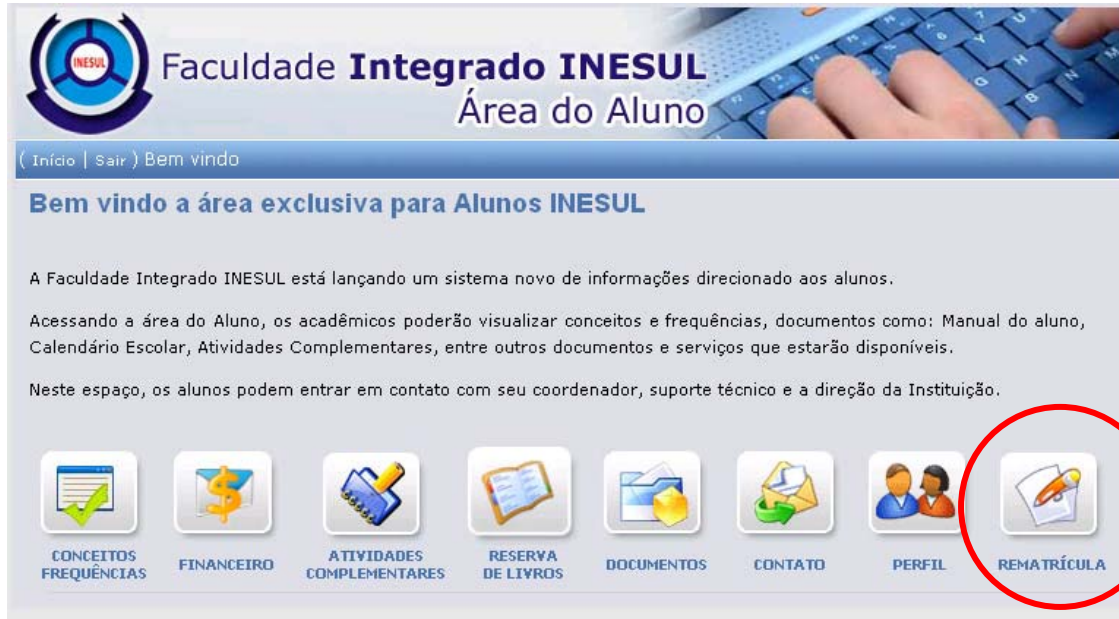
IMAGEM 03 - ÍCONE DE REMATRÍCULA

2º PASSO - APÓS O ALUNO REALIZAR O ACESSO ATRAVÉS DE SEU LOGIN E SENHA, SERÁ APRESENTADO UM ÍCONE “ REMATRÍCULA ” ONDE DEVERÁ SER CLICADO, CONFORME IMAGEM 03.