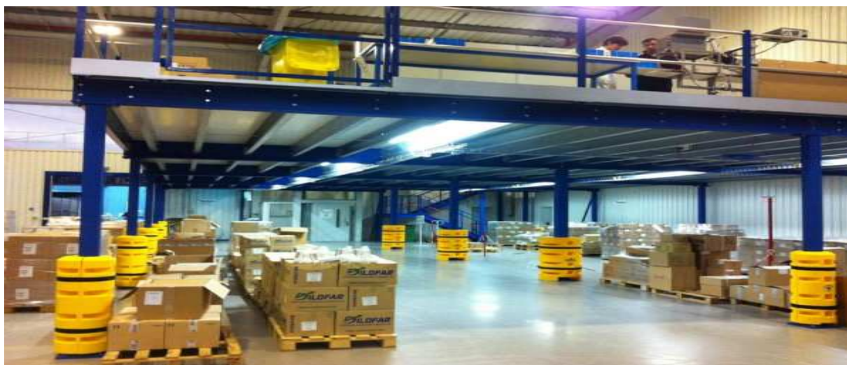
Figura 04 – Imagem da Área de Picking e Expedição

Destacam-se, assim, duas estratégias de carregamento: Agrupar diversos produtos solicitados, semelhantes ou diversos, formando uma única carga o que facilita o manuseio e o transporte dos materiais é até mesmo a redução de custos. Organização das cargas de acordo com a ordem das entregas a serem efetuadas: Acondicionar o carregamento dos materiais solicitados de acordo com a ordem das entregas a serem realizadas. Isto é, o último local de entrega deve ser o primeiro pedido a ser colocado no veículo e o primeiro local de entrega deve ser o último pedido a ser carregado.