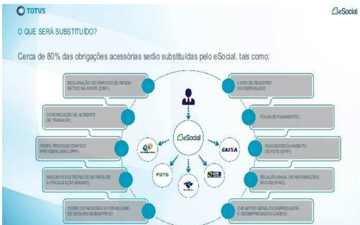
Figura 02 – As Substituições