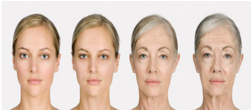
Fig. 2- Envelhecimento Precoce