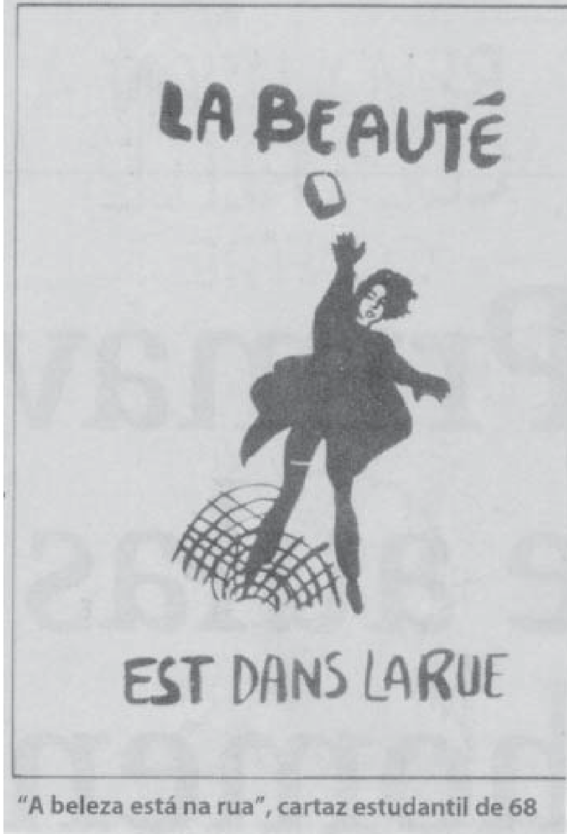
"A beleza está na rua", cartaz estudantil de 68

Uma outra atenção se deve à condição especial de que, aqui, não estarei interessada unicamente, em destacar, ou pontuar registros datados da História do Feminismo, para o que já dispõe de um grande número de trabalhos. Nesta perspectiva, amplio a designação de feminista a todas as mulheres que, intencionalmente, integraram contingentes de lutas por mudanças nas relações de gênero, quer em partidos políticos, quer em sindicatos, em associações de bairros, ou nos grupos organizados de mulheres. São as lembranças destas mulheres, que constituem, para este trabalho, material de grande valor, e de substancialidade para a compreensão da unicidade e multidimensionalidade de alguns dos mais significativos movimentos relacionais, da conjuntura sócio-política dos anos 70 e 80.