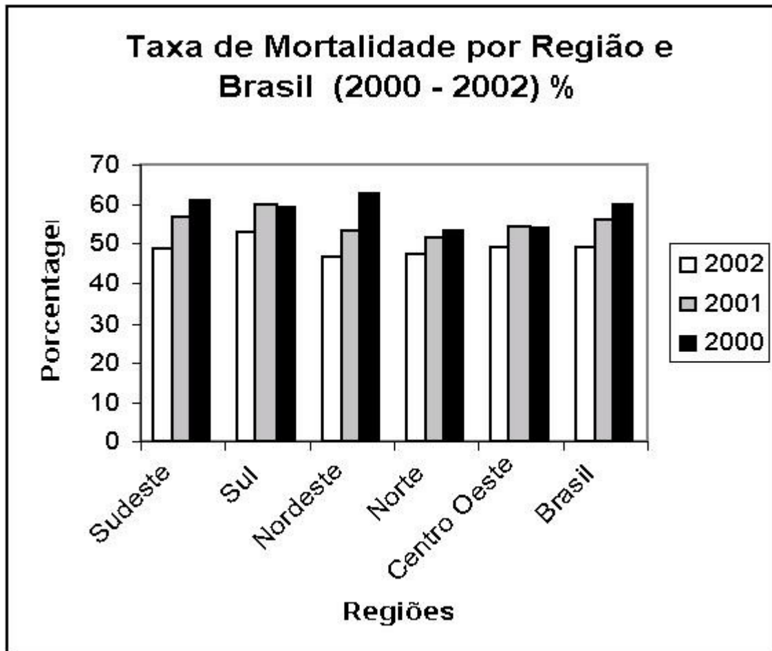
Gráfico 2. Taxa de mortalidade por Região e Brasil (2000-2002) % (Dados extraídos da Tabela 4)

Podemos visualizar através da tabela 5 uma comparação entre a estimativa de natalidade e a mortalidade das empresas, por região do Brasil e também no Brasil. Já no gráfico 3 somente a Região Sudeste e no gráfico 4 o percentual do território brasileiro.